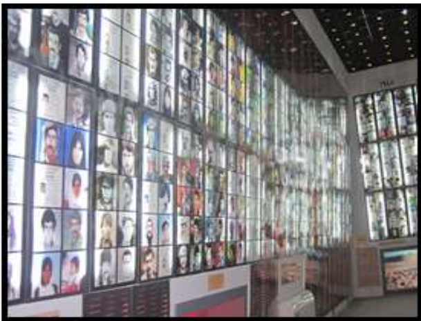
التقطه بتاريخ 3-7-2022.