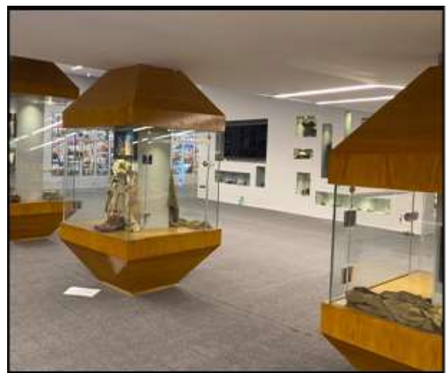
صورة (4) متحف الأنافل