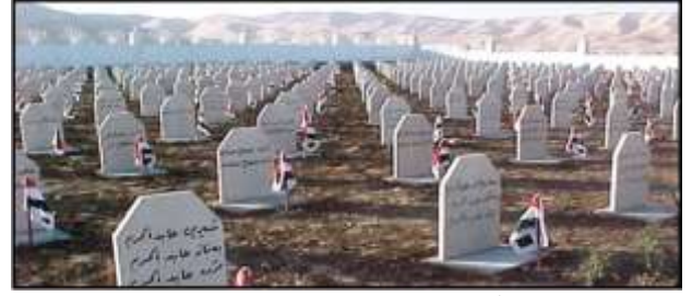
التقطه بتاريخ 25-7-2022