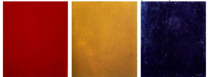
ئەلىكساندەر رۆدچىنكۆ، رەنگە پوختەكان: سور، زەرد، شىن، ۱۹۲۱. (وینەى ژمارە 6)

پىوېستە لىردە ژيارى ئەومان ھەبىت كە كۆنسىپتى مۆتۆرۆم لە وینەكیشاندا، لە يەك كاتدا بىرى ئۆتۆتۆمى مۆدېرنىزم و بىرى هیترومۆمى ئافانت-گارد ئامېزى بۆ