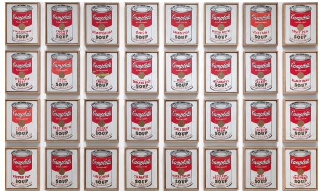
ئاندي وارهُول، قوتووي سوپهکانى کامپيئل، ۱۹۶۲. (وينهي ژماره ۲)

لهم کارهي نهگنسه مارتيندا تيدهگهين که له 'گرېدا' لؤجبيکي فؤرمال ههيه بؤ ريکخستن، وهک تؤر يان خشته دتووين وهريرگين که چهي نيه و بؤ کوتا دووباره دهبنتهوه. ههر ليرمه کراوس دهرزاه بؤ دووباره کردنهوه دهکاتهوه و ديارى دهکات له پرؤسهي کارى هونهريدا، له برى قهتيس کردني هونهر له ناو بيرى نهفسانهي رهسه نيئيدا. نهم دياردهيه نهک تهنا ميدياي وينه کيشان، بهلکو پهلي کيشايه ناو ميدياي ههمه جؤر و سي رهه ندي و ديچينال و چاپ و ..هتد. بؤ نمونه نهو ستراکچهره سي رهه نديانهي که سؤل ليويت کارى لهسر دهکات له شهستهکاندا که دووباره کردنهوهي فؤرمي شهشپالوه. نام جون پهيك تهله فيزونهکان به ئينسته لهيشن دادنهت له تهنيشت يهکتردا و دووباره دهبنتهوه، ئاندي وارهُول وينه چاپکراو و کيشراوهکانى دووباره دهکاتهوه که ليدانه له بيرى داهينهريتي و رهسه نيئي له ناو وينه دروست کردندا. بؤ نمونه سوپي کؤمپانياي کامپيئل (وينهي ژماره ۲).