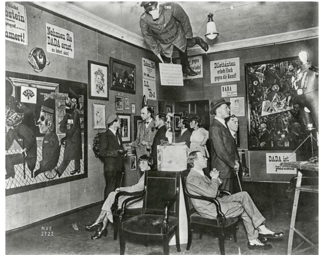
بەكەمەین پىشانگای نىوەندەلەقى دادا، بەرلین، ۱۹۲۰. (وینەى ژمارە ۵)

دەكەنەو، لەگەڵ ئەوەی بە روالت چوونەكە بەلام لە دوو پرۆسەس و ئیدیۆلۆجی تەواو جیاوازدان، بەكەم ئەو روانگە مۆدێرنیستیە بە كە گرنگی دەداتە پرۆسە ئەبستراكشن و جەخت كەردنەو لەسەر دوو رەهەندێتی میدیەمی وینەكیشان. واتە ئەم سادەكەردنەو بە لە ئۆتۆتۆمدا جەختكەردنەو بە لەسەر بە درەخستنی رەهەبەتی میدیەم. دووهم روانگە ئافانت-گارد بۆ ئۆبجېكتی رۆژانە كە لە (رېدى مەيد، مېرز، فۆتۆمۆنتاچ، فرۆتچ.. هتد)دا خۆی دەخاتە رۆو، كە كارېگەری لەسەر وینەكیشان دادەنێت و بەرەو كەناری ئۆبجېكتی رۆژانە دەبات. واتە هەمان سادەكەردنەو لە هیترومۆمدا، دەكریت بریتی بێت لەو رۆو تەختەى كە لە هەر جینگایەكى ناو ژيانى كەردا بەرى دەكەوین. كەواتە گەر پانتایەكى سادەى تەختى يەك رەنگى وەرگىرین بە تىگەيشتنىكى ئۆتۆتۆمى مۆدېرنىستانە بریتىە لە بەها بەخشین بە هونەر و میدیەمی وینەكیشان، بەلام گەر بە تىگەيشتنىكى ئافانت-گاردیانە لىنى بروائىن، بریتىە لە لىسەننەو ئەو بەهائە و لىدانى، وە لە جىگەى بردنى بۆ ناو كۆنتىكسنتىك كە دەبىخاتە دۆخى ئەزەمىنەو بە لىوان هونەر و ناھونەردا (لە بەشى يەكەمدا ئامازەمان بەم نىوەندە دا لە نىوان ماركسىل دوشا و جاسپەر جۇنس) دا.