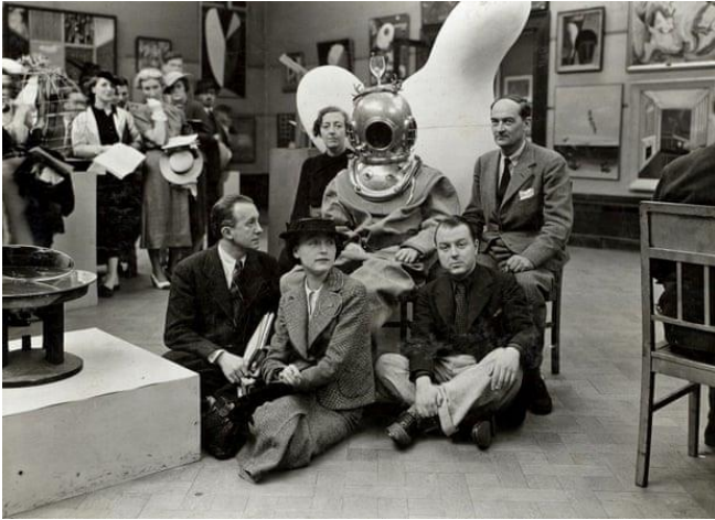
سەلفادور دالى، (راستەقىنە، پارانتويا، تارماي) بۇ ناو قولايەكەنى ناخودتاگا، ۱۹۳۶، پيشانگاي نپودەولتى سورپاليزم، لەندن. (ويئەنى ژمارە ۴)

كانتەيە كە ناوەرۇكى ھونەر كارەكتەرە رامپارپەكەى ون دەكات و چىدى ناپەويټ بېئە شىئىكى دى جگە لە ھونەر (واتە ھونەر بۇ ھونەر). (Bürger 1974 p. 26) 27) كەواتە ليزەدا رپون دەبېئەوۋە كە (ھونەر بۇ ھونەر، فۇرمايزم، ئۇتۇتۇمى ھونەرى) ھەموو دەچنەوۋە ژىر چەترى مۇدېرنېزم، بەلام ئافانت-گاردى-مېژووي پەپەست دەبېئەوۋە بە ھونەر وەك ھېتۇتۇم.