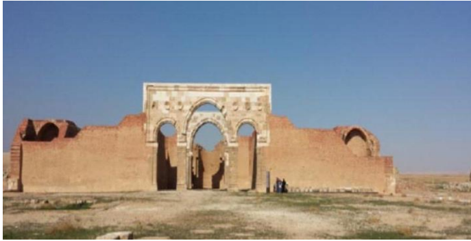
پاشکوی ژماره (5)

وینہی پاشاوهی کوشکی مشتی غساسنهکان له ولاتی ئوردن که تاوهکو ئیستاش