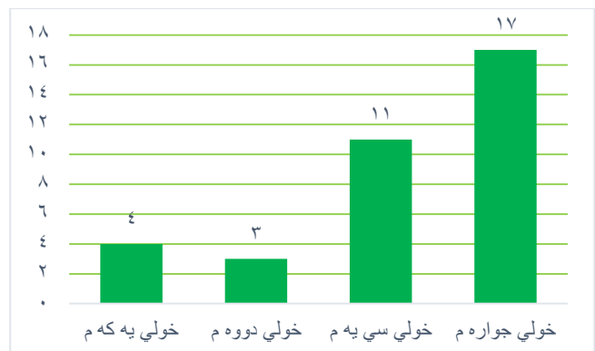
شێوی ژماره (3)

لیسته بەشداریبووەکانی هەلبژاردنی خۆی یەکەم- چوارەمی پەرلەمانی کوردستان (1992 و 2013)