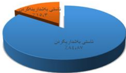
نێستی بەشداریکردن 28.84% نێستی بەشداریکردن 78.84%

کۆمەلەكەيان بۆنەروو و پېش بەرژەوهندی حزبهکانیان، ئەوا بوونی فرەدەنگی و فرەدەنگی لەتیو پەرلەماندا کاریگەری زیاتری دەیت بۆ پرۆسەى بریارسازی که لە خزمەتی کۆی هاوالاتی دادەیت ( ).