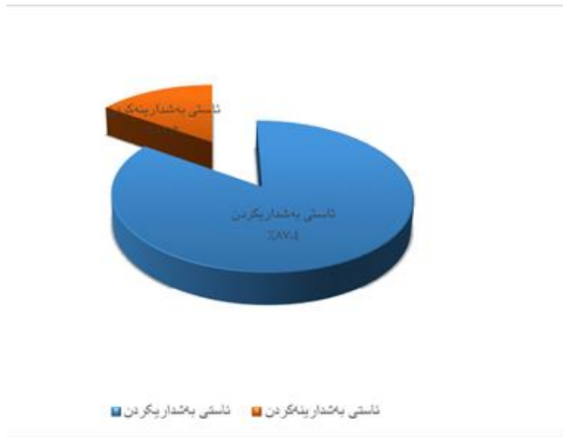
شێوهی ژماره (1)

رێژهی ئاستی دهنگدان و دهنگههاندان لهههلبژاردنی پهڕلهمانی سالی 1992